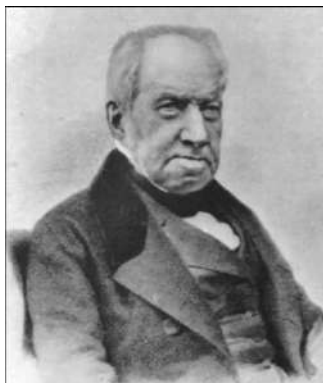
Robert Brown (1773–1858)