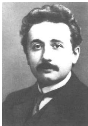
Albert Einstein (1879–1955)

brownowskiej nie była gładka, miała mnóstwo zygaków, ba, miała zygak w każdym punkcie, co w języku matematycznym oznacza, iż nie była nigdzie różniczkowalna. To była prawdziwa rewolucja, odejście od ustalonego i uznanego paradygmatu – rzecz w tym, iż to podejście dawało wyniki zgodne z eksperymentem, podczas gdy wszystkie inne nie. Wspomniane wcześniej równanie dyfuzji nie opisuje trajektorii pojedynczej cząsteczki, ale zbiorowe, uśrednione zachowanie całego mrowia cząsteczek, na przykład kropli atramentu wpuszczonej do naczynia z wodą lub cukru, którym słodzimy herbatę 5 . Z punktu widzenia obserwatora zewnętrznego to nie losy pojedynczej cząsteczki, ale zbiorowe losy całego zespołu rozpuszczanych cząsteczek są ważne. Choć trajektoria pojedynczej cząsteczki, składająca się z samych zygaków, może być dziwaczna, to zbiorowe zachowanie bardzo wielu cząsteczek daje się opisywać w sposób całkiem „przyzwyczajony”, jeśli tylko zgodzimy się nie zwracać uwagi na bardzo drobne szczegóły. W tym właśnie tkwi istota podejścia probabilistycznego.