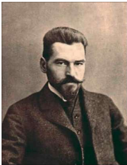
Marian Smoluchowski (1872–1917)

mianowicie, że średni kwadrat przesunięcia cząstki brownowskiej, \langle x^2 \rangle , powinien być proporcjonalny do czasu trwania obserwacji, współczynnik proporcjonalności zaś jest ściśle związany z tzw. współczynnikami dyfuzji. Wnioski te pozwoliły na wykonanie wielu szczegółowych pomiarów, zwłaszcza zaś na doświadczalne wyznaczenie tzw. stałej Avogadra. W kilka lat po ukazaniu się prac Einsteina i Smoluchowskiego pomiary takie przeprowadził francuski fizyk Jean Baptiste Perrin, za co w 1926 roku został uhonorowany Nagrodą Nobla.