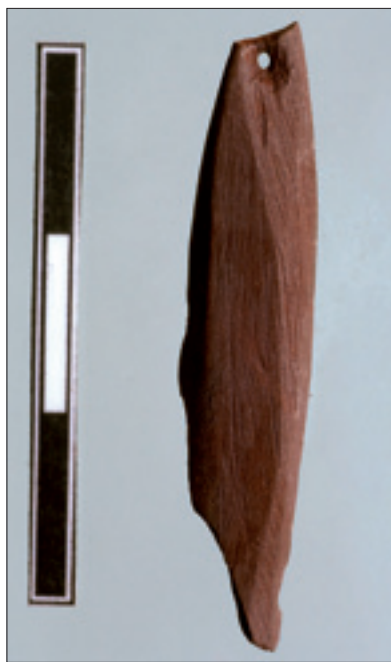
Dzierżysław 35. Zawieszka z płytki hematytowej

Najbardziej charakterystycznym znaleziskiem jest sześciocentymetrowej długości figurka, nawiązująca do innych środkowoeuropejskich, zwłaszcza z terenu Niemiec, figurek określanymi mianem magdaleńskich Venus 4 . Figurka została wycięta w płytce hematytu. Posiada schematycznie zaznaczoną głowę i lekko zaznaczony, asymetryczny biust. Jest wyraźnie uszkodzona, lecz po uszkodzeniu próbowano ją jeszcze naprawić. Drugim ciekawym przedmiotem jest płytka hematytu z rytami na szerszej płaszczyźnie, przedstawiającymi kilka