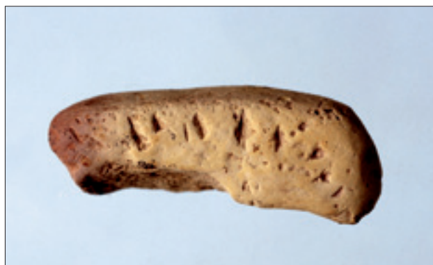
Dzierżysław 35. Fragment płytki hematytowej z ornamentem lub śladem notacji (?)