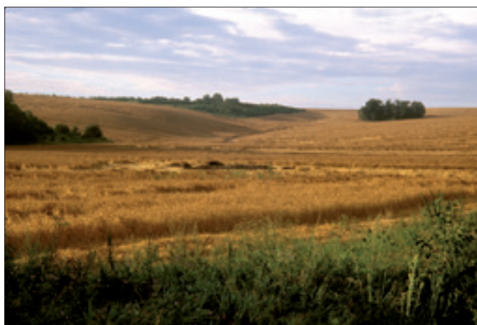
Dzierżysław. Usytuowanie stanowiska 35

Podczas wspomnianych powyżej badań w 1996 roku natrafiono