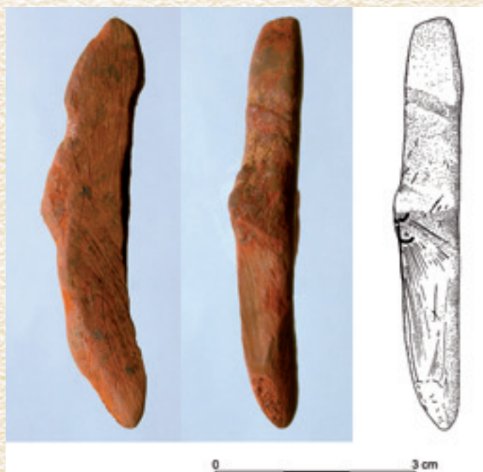
Dzierżysław 35. Figurka tzw. Wenus z płytki hematytowej