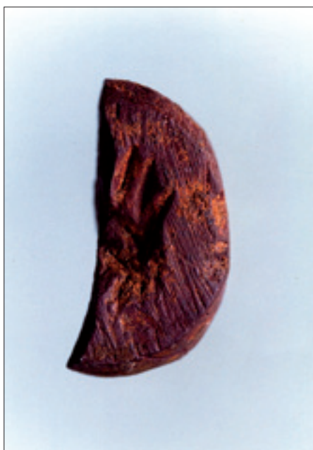
Dzierżysław 35. Fragment paciorka z hematytu z niedowierconym otworem

Obozowisko z Dzierżysławia jest jednym z zaledwie pięciu stanowisk magdaleńskich z trójkąkami, znanych dziś z obszaru Europy poza granicami Francji. Pozostałe cztery leżą na terenie Moraw, Niemiec oraz Szwajcarii, z których tylko jedno, w jaskini Kniegrotte w Turynii, dostarczyło bogatego inwentarza kamiennego i kościanego – nieobecnego w Dzierżysławiu. Jest nasze stanowisko bardzo ważnym przyczynkiem do dyskusji nad zagadnieniami ekspansji ludności magdaleńskiej na tereny Europy środkowej, wewnętrznych podziałów tej kultury i jej chronologii. Obozowisko to należy także do najlepiej zachowanych w naszej części Europy. Jest pierwszym w Polsce i jednym z kilku zaledwie w Europie środkowej stanowisk z tego okresu z dobrze zachowanymi pozostałościami